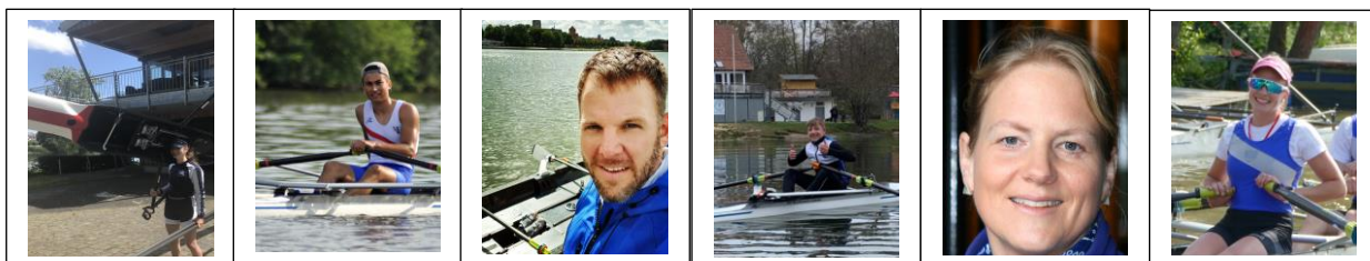
Einige der Teilnehmer*innen